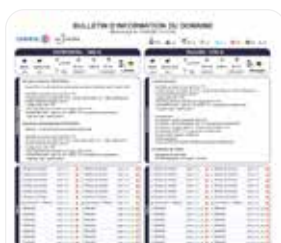
Informations pratiques Bulletin Météo&Neige (web)