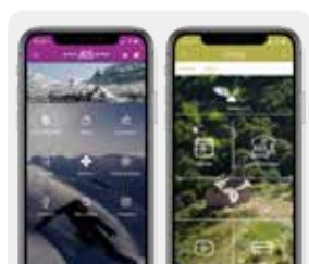
L'information embarquée Applications officielles