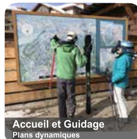
Accueil et Guidage Plans dynamiques