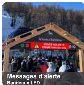
Messages d'alerte Bandeaux LED